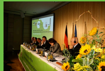
Die Grüne Klimakonferenz in Bonn

Cancun steht nun kurz bevor, ein starkes Signal der EU blieb bislang aus. Im Dezember wird sich zeigen, ob die Europäische Union ihre Hausaufgaben gemacht hat.